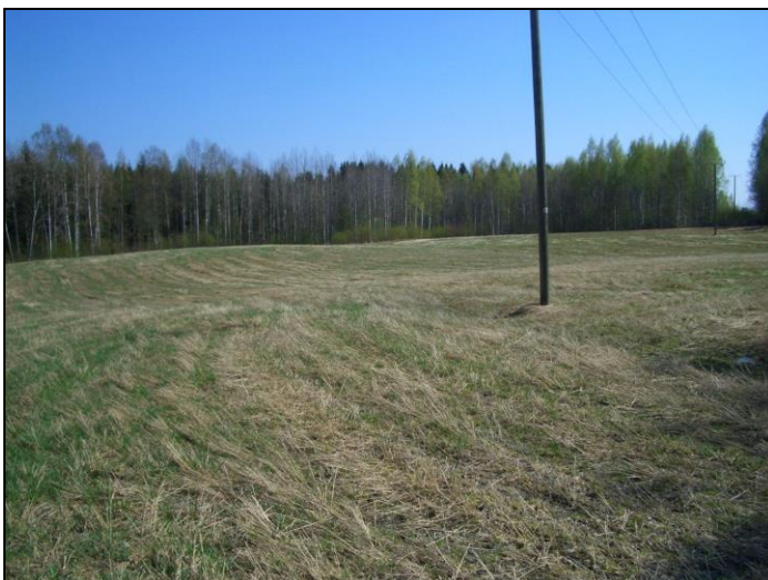
Hinkanlammen eteläpuolista peltoa.